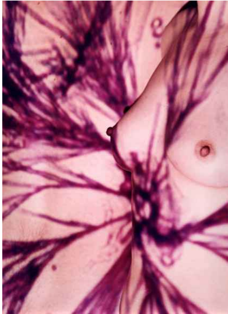
▲ SU TACTO (70x100cm) 2003