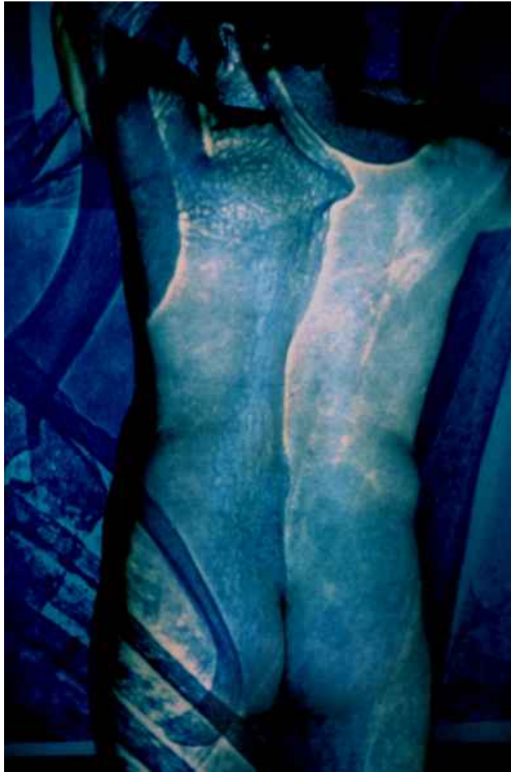
▲ TRANSMUTACION (70x100cm) 2005