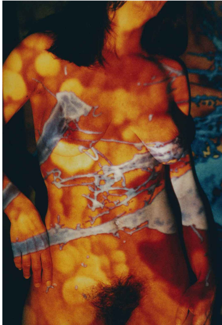
▲ PIEL DE LUZ (70x100cm) 2006