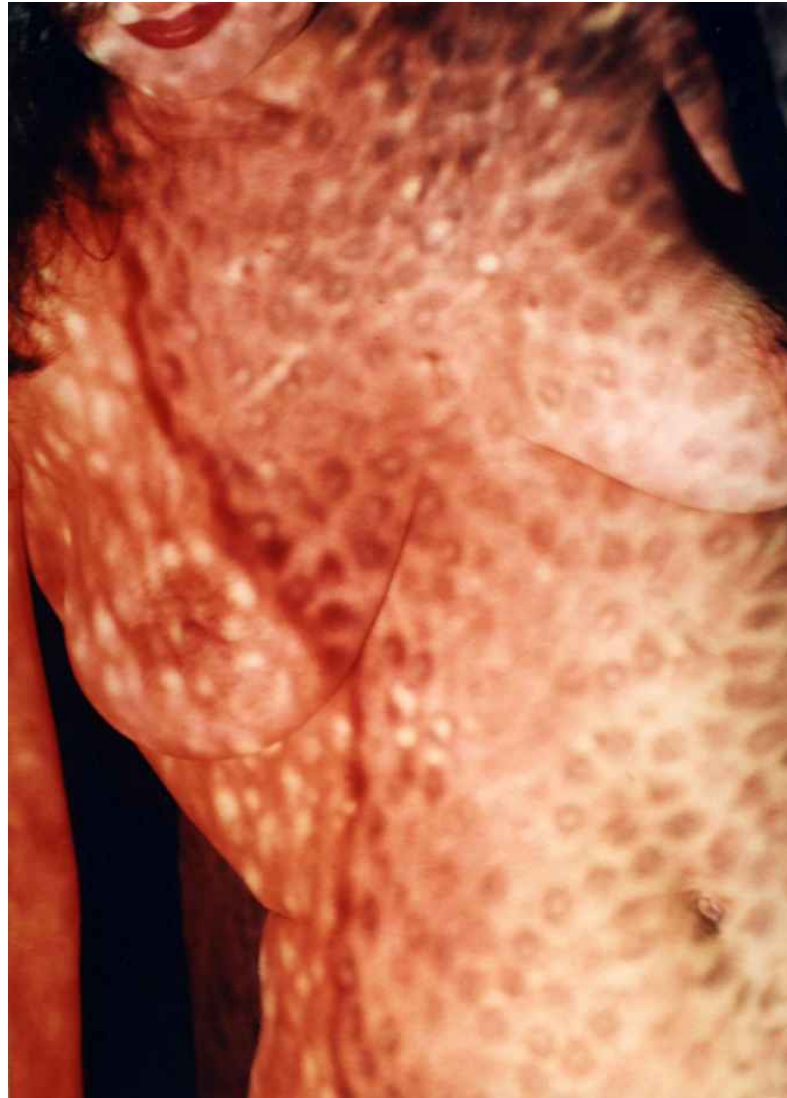
▲ TRANSFORMACIÓN 10 (70x100cm) 2003