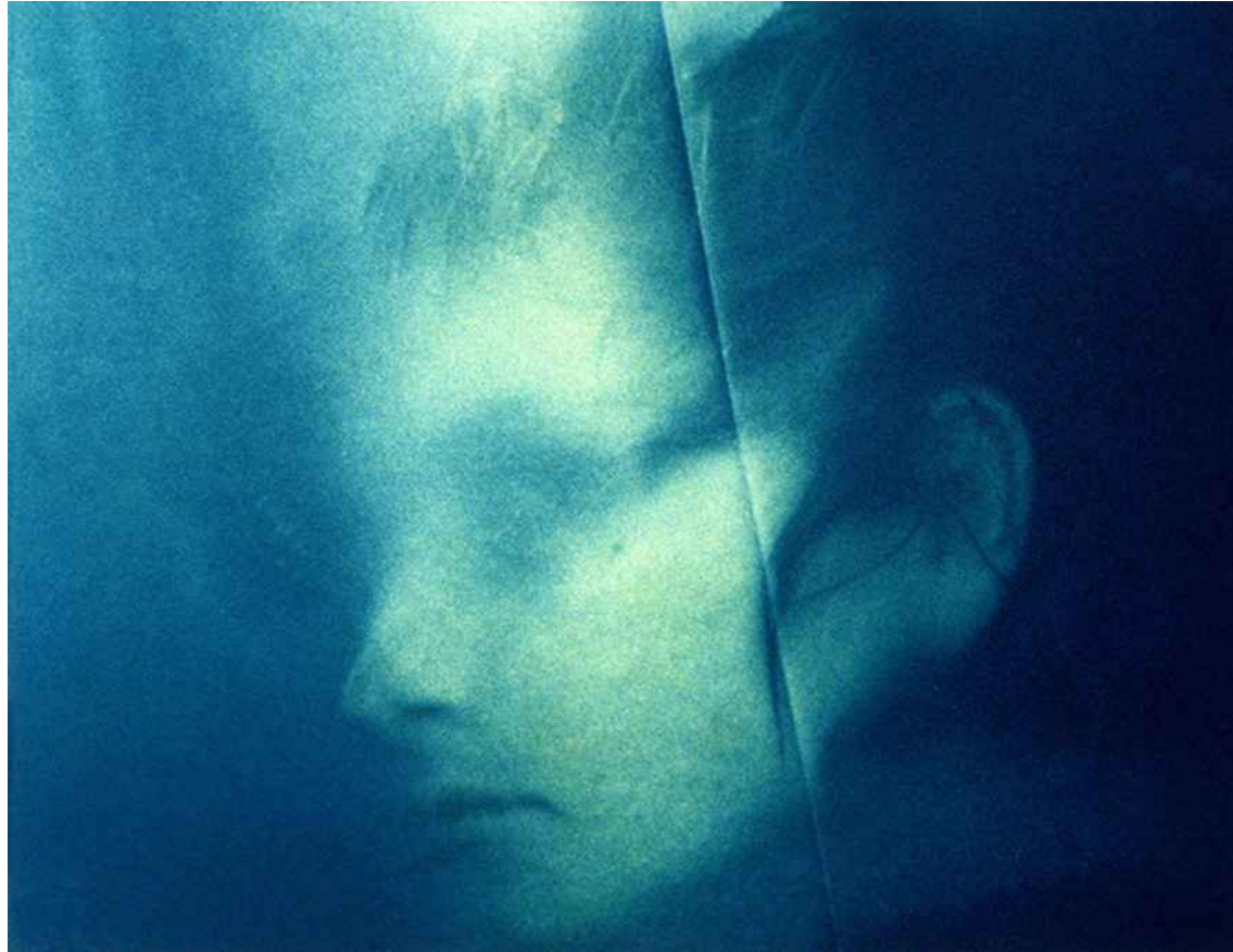
▲ SEDUCCIONES (100x70cm) 2003