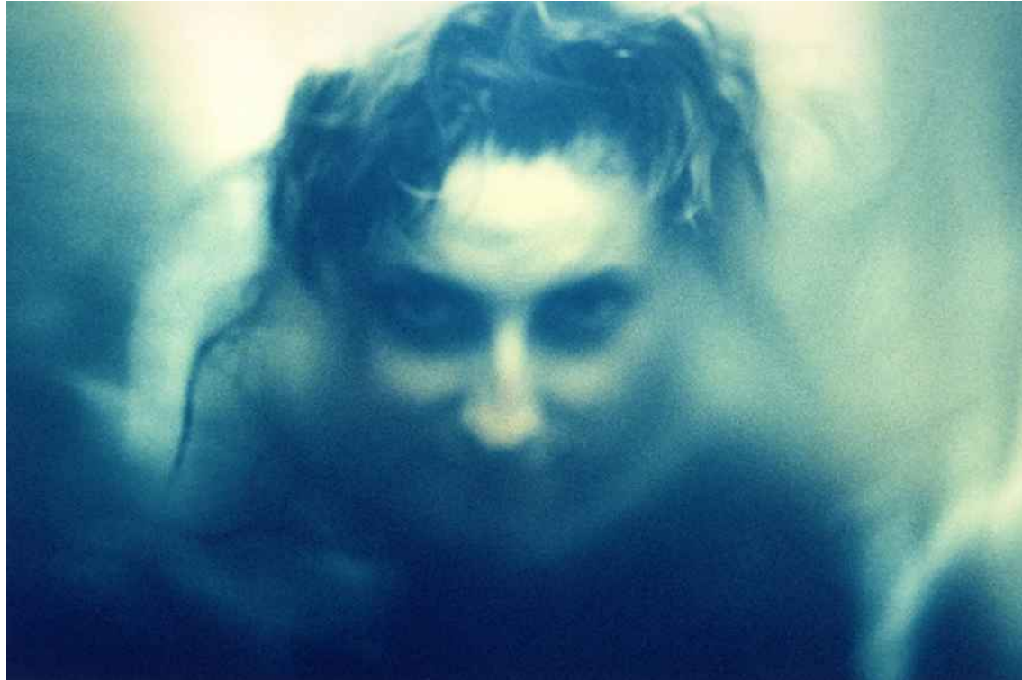
▲ AGUAMARINA (100x70 cm) 2004