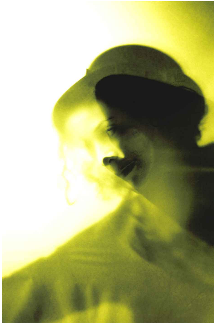
▲ PENSAMIENTOS (70x100cm) 2005