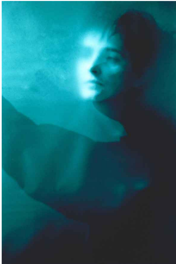
▲ MELANCOLÍA (70x100cm) 2006