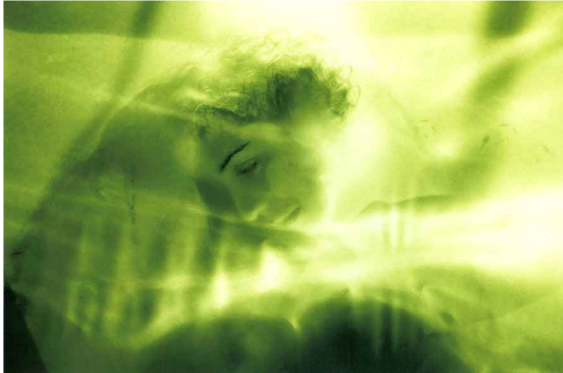
▲ MIRADAS DESDE EL LIMBO (100x70cm) 2006