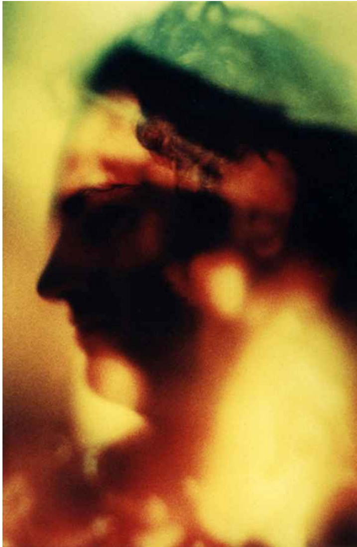
▲ SUEÑOS DE SILENCIO (70x100cm) 2004