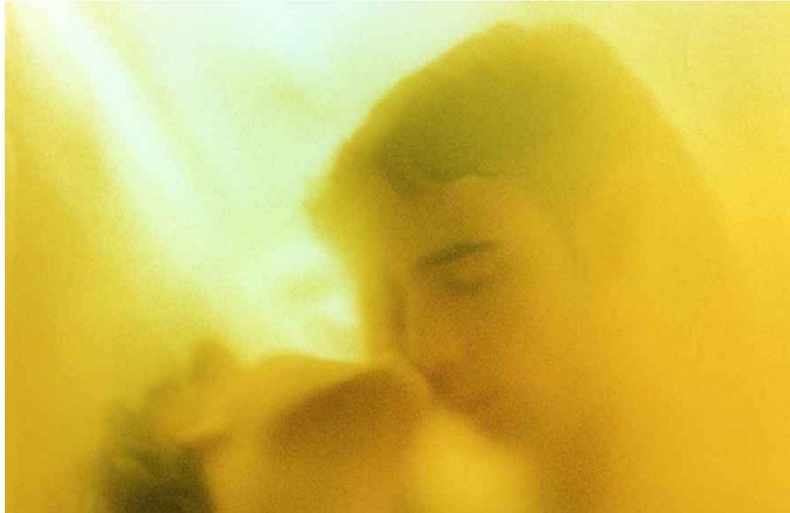
▲ AUSENCIAS (100x70cm) 2003